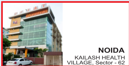
NOIDA KAILASH HEALTH VILLAGE, Sector - 62