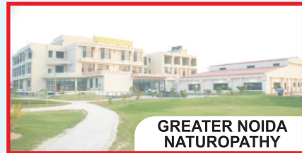
GREATER NOIDA NATUROPATHY